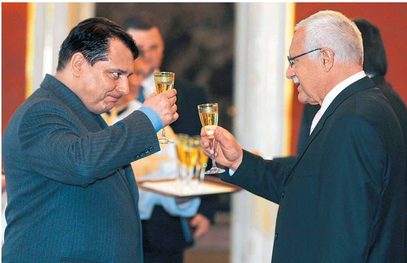
PAROUBEK: ZAČÍNÁM. Prezident Václav Klaus si připije s Jiřím Paroubkem na zdar vlády, do jejíhož čela jej právě jmenoval. Krátce předtím Klaus přijal demisi Paroubkova předchůdce Stanislava Grosse.